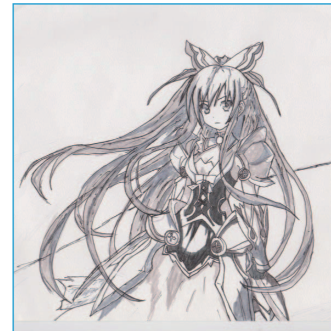
Dessin de Gwenaël Duteil.

Le Shōnen. Dans ce type de manga, en général pour les jeunes garçons adolescents, même si plusieurs types existent dans le shōnen, il s'agit souvent du héros principal qui se bat pour des valeurs justes et importantes. Quelques exemples de Shōnen : Bleach, Blue Exorcist, Dragon ball, Fairy tail, One piece, Naruto.