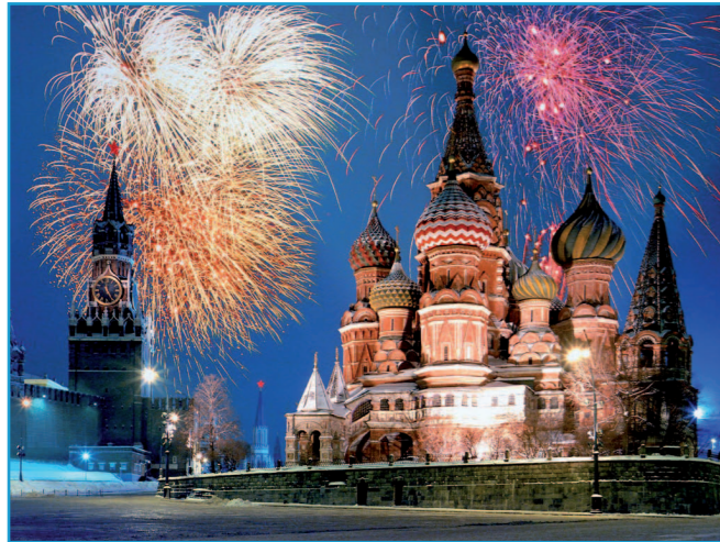
Le nouvel an à Moscou sur la place Rouge.

Je suis né à Volgograd en 1991. Volgograd est l'ancienne Stalingrad, elle se trouve au sud-est de la Russie. Je vais vous raconter combien il est beau mon pays.