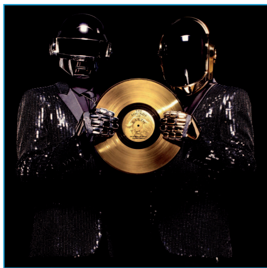
Daft Punk et leur disque d'or.

Dès 1994, ces artistes commencent à produire des titres qui grimpent rapidement dans les classements ( charts ) britanniques et ne laissent pas indifférent les critiques d'outre-manche. La French touch balbutiante voit apparaître de plus en plus d'artistes tel que Air, Dimitri from Paris ou Daft Punk. En 1996, l'album Homework des Daft Punk achève d'établir ce mouvement musical sur les scènes nationales et internationales.