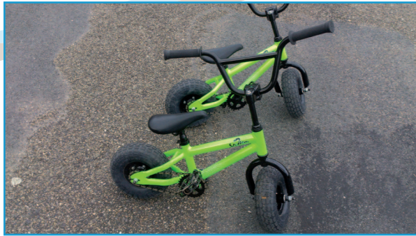
Mon mini bike et celui de mon voisin

Je m'appelle Dan, j'ai bientôt 18 ans. J'ai la moto pour passion mais aussi le BMX, le fameux mini bike.